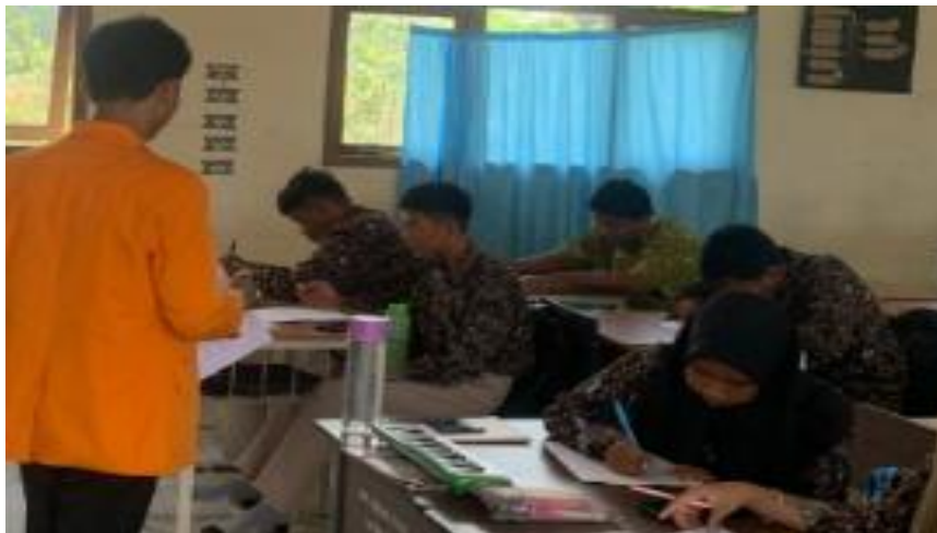
Gambar 2. Perlakuan Kelas B menggunakan metode ceramah

Populasi dalam penelitian ini adalah seluruh siswa kelas XI di SMAN 15 Muara Jambi yang terdaftar pada tahun ajaran 2024/2025. Sampel penelitian diambil dengan menggunakan teknik purposive sampling, yaitu pemilihan kelas yang dilakukan secara sengaja berdasarkan kriteria tertentu. Dua kelas yang terpilih adalah kelas A dan kelas B, yang masing-masing terdiri dari 23 siswa/i kelas A dan 20 siswa/i kelas B. Kelas A dipilih untuk menerima pembelajaran menggunakan PHET Simulation, sedangkan kelas B diberi perlakuan dengan metode ceramah konvensional. Pemilihan kedua kelas ini didasarkan pada kesamaan dalam aspek demografis, tingkat kemampuan akademik, serta minat belajar fisika yang relatif seragam, yang akan memastikan bahwa perbedaan yang diamati dalam pemahaman konsep lebih disebabkan oleh metode pembelajaran yang digunakan, bukan faktor lainnya.