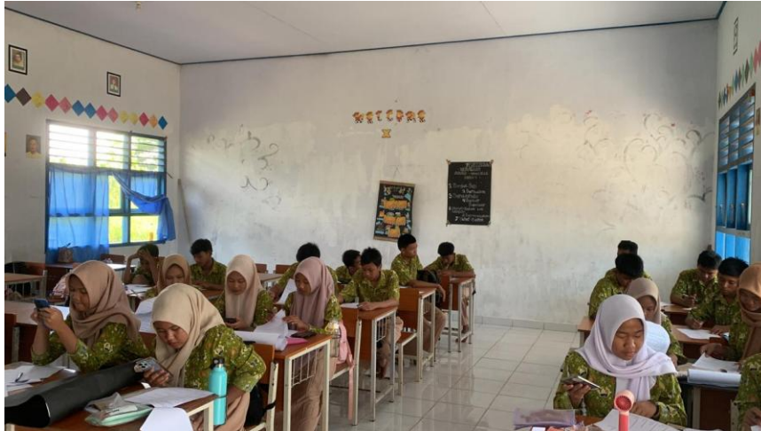
Gambar 1. Perlakuan Kelas A menggunakan PHET Simulation